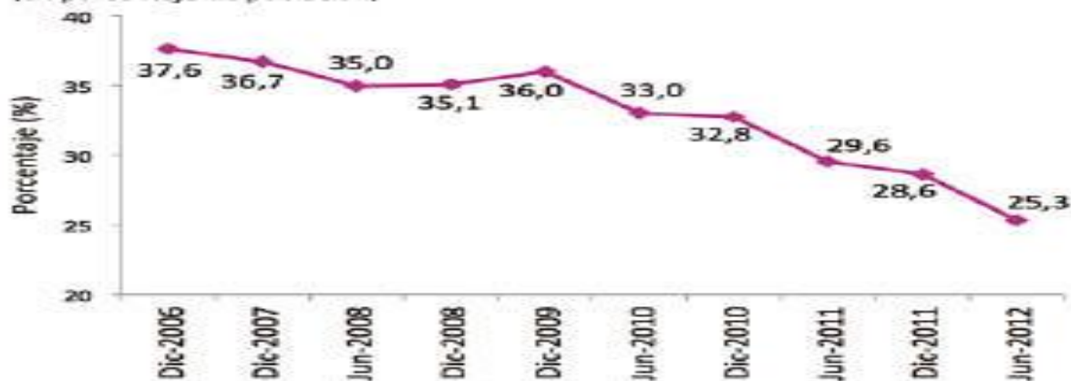
Pobreza por ingresos (en porcentaje de población)